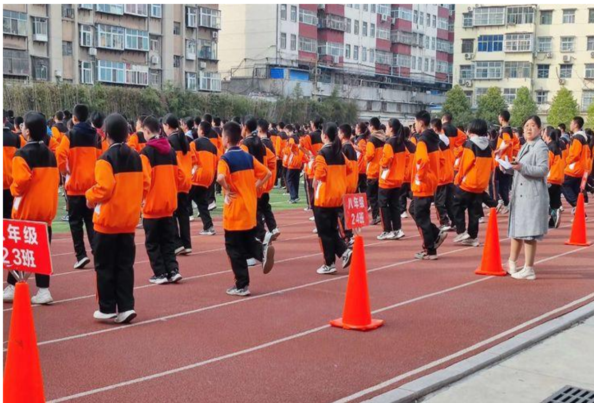
校园文化的熏陶，使学生更加热爱生活。