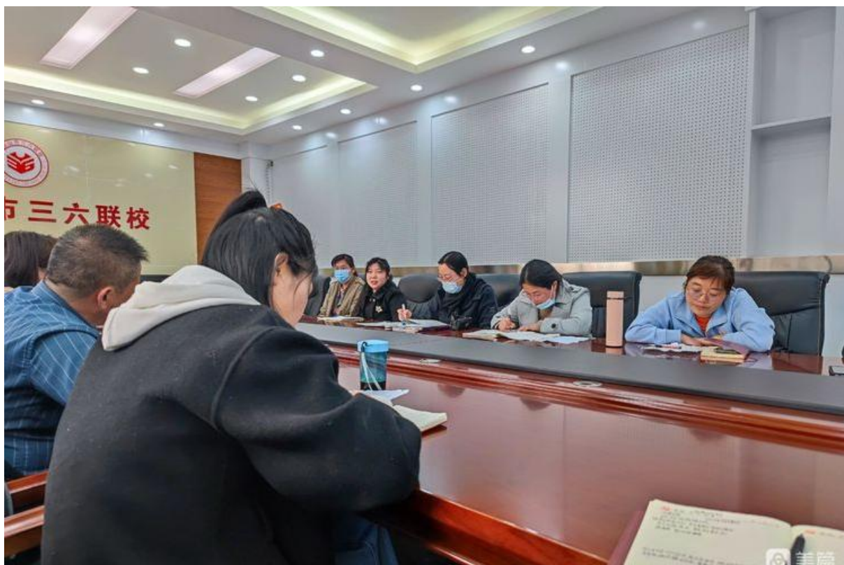
参与年级听课、教研组听课并与年级领导进行交流