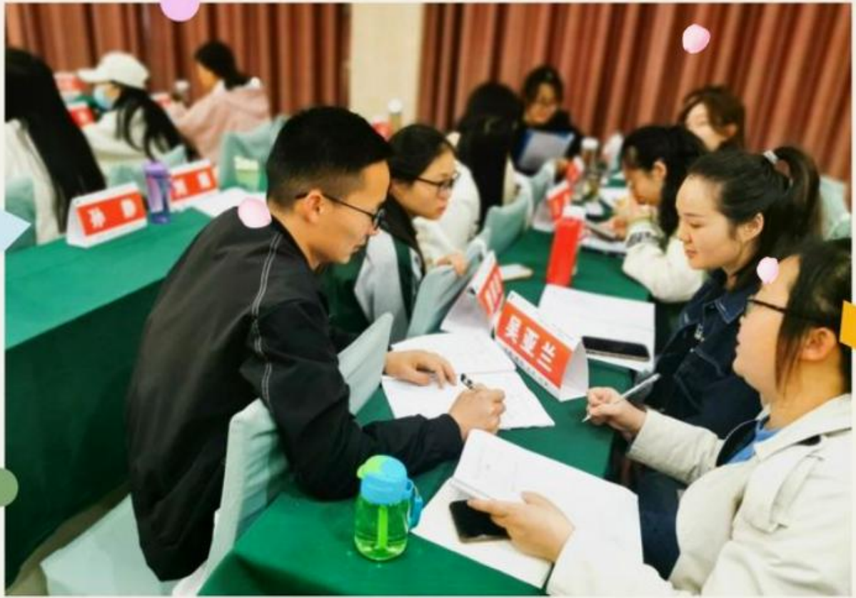
通过第一轮讨论，组长留下，小组成员参与其他小组议题再次进行交流。